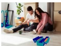
l'Aide à l'Installation des Personnes (AIP)